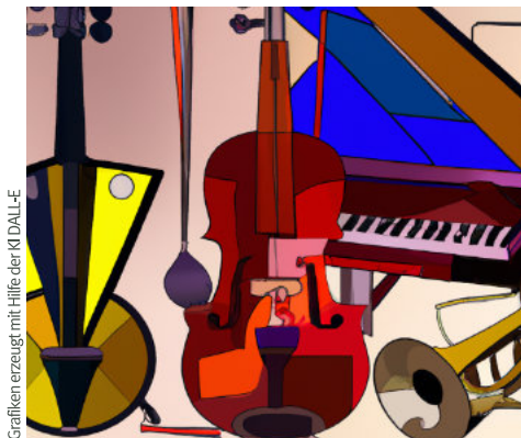
Grafiken erzeugt mit Hilfe der KI DALL-E