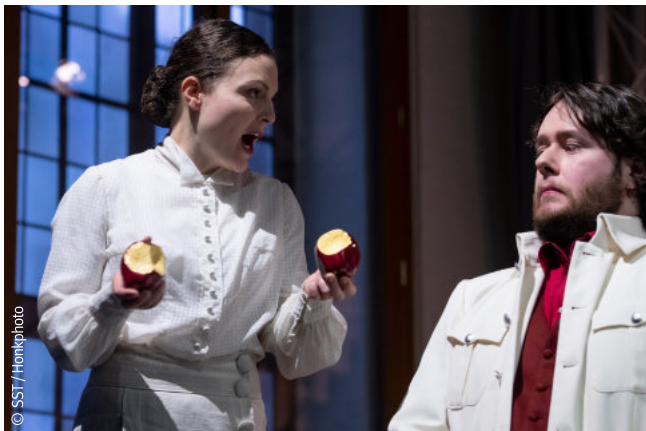
Szene aus der Oper „Albert Herring“ (2022): Auftakt der gemeinsamen „Musiktheaterakademie“ der HfM Saar mit dem Saarländischen Staatstheater.

Die Kooperation „Musiktheaterakademie“ der HfM Saar mit dem Saarländischen Staatstheater (SST) dient der praxisnahen Förderung von Studierenden der HfM Saar aus den Fächern Oper und Musiktheater. Ziel ist es, Studierende in Produktionen des SST einzubinden und gemeinsame Produktionen unter Mitwirkung von Lehrkräften und Studierenden der HfM Saar zu realisieren. Bei der Weiterentwicklung ihrer Lehrangebote ist es der HfM Saar ein zentrales Anliegen, die Studierenden optimal auf ihre spätere künstlerische oder auch pädagogische Tätigkeit vorzubereiten. Dabei sind Praxiserfahrungen, wie sie die Kooperation mit dem SST bietet, außerordentlich wertvoll.