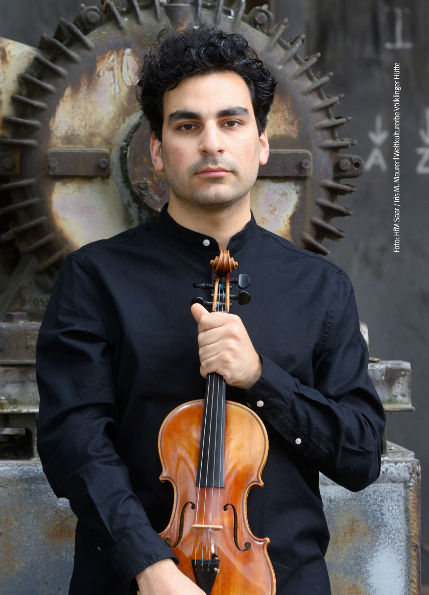
Foto: HFM Saar / Iris M. Maurer | Weltkulturerbe Völklinger Hütte