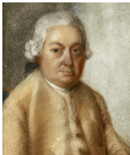
Carl Philipp Emanuel Bach (1714 - 1788)

Das Collegium Instrumentale wurde 1974 von Studierenden der Hochschule für Musik Saar gegründet, war aber von Beginn an auch offen für interessierte Laien, die inzwischen den größeren Teil des Orchesters ausmachen.