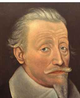
Heinrich Schütz (1585 - 1672)

Heinrich Schütz' Weihnachtshistorie war die erste Historie, in der der chorale Lektionston und die rezitativische Erzählmelodie gleichwertig dokumentiert sind. Zugleich war sie die erste Historie, bei der die Ganzheit des Singens und Spielens der Übersetzung des Wortes in die Musik dienstbar gemacht wurde.