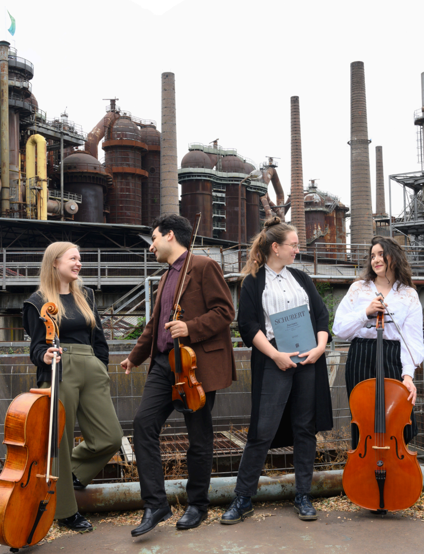
Foto: HfM Saar / Iris M. Maurer | Weltkulturerbe Völklinger Hütte