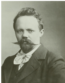
Engelbert Humperdinck (1854 - 1921)

Sa 4. Nov. | 19 h Congresshalle Saarbrücken