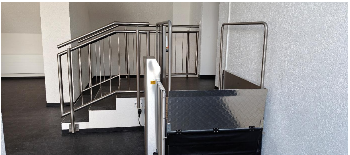
Abbildung 3: Plattformlift im Aufenthaltsbereich der HfM Saar Trierer Straße 2-4, DG