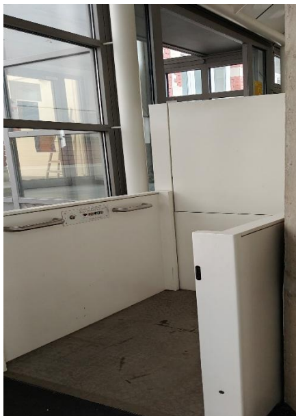
Abbildung 4: Treppenaufzug im Eingangsbereich Schillerschule/Theo-Brandmüller-Haus