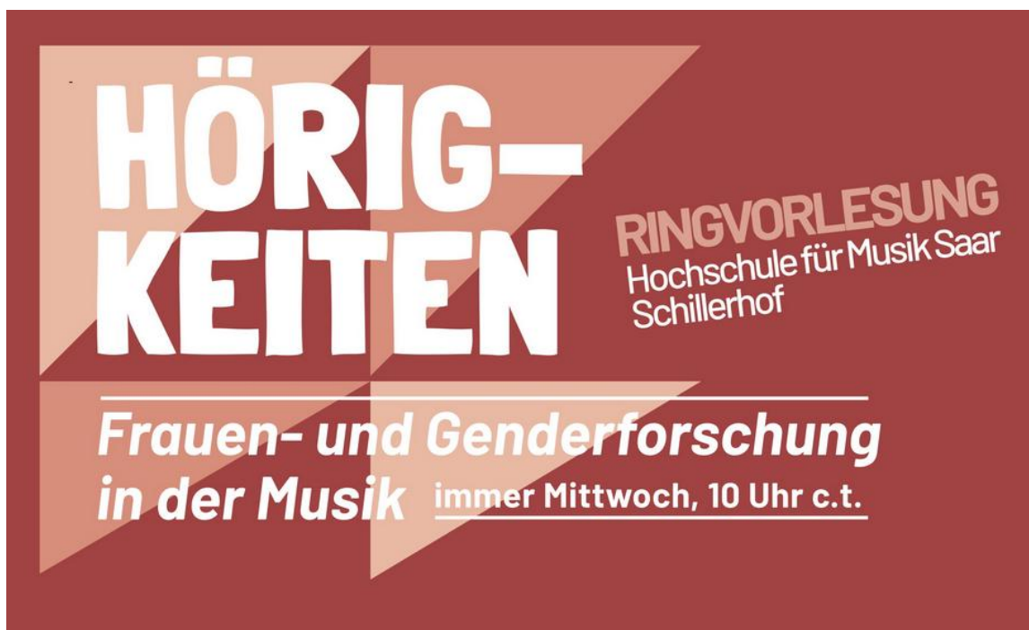
Abbildung 1: Flyer zur Ringvorlesung, abrufbar unter https://www.hfmsaar.de/hoerigkeiten-ringvorlesung-2025

An der HfM Saar werden Sensibilisierungsmaßnahmen vorgenommen, die reflexive Räume für Wahrnehmungs- und Machtfragen schaffen, z.B. die Ringvorlesung „Hörigkeiten – Frauen und Genderforschung in der Musik“ im Sommersemester 2025. Die Veranstaltungsreihe stieß auf großes Interesse und soll in diesem Format fortgeführt werden.